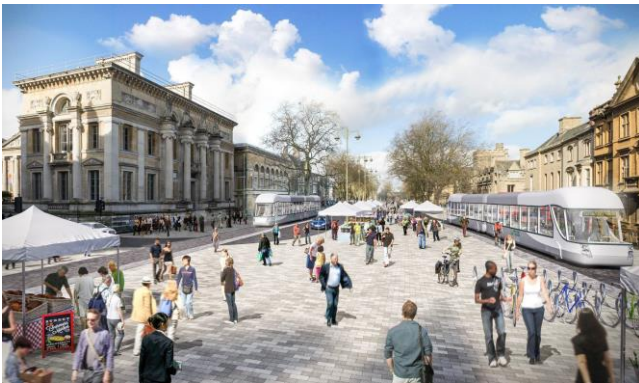
Traffic management.. Walking & cycling.. Mass transit

De organisatie probeert bewoners (vooral automobilisten) te overtuigen om te fietsen naar hun werk, school, winkels, enzovoort. Ook is men bezig ambtenaren te overtuigen van het belang van het vervoer op de fiets in de context van het hele stedelijk vervoer. De fiets is een vervoersmiddel met toenemende populariteit, omdat er veel studenten in Toruń zijn (± 30.000 studenten). Tot nu toe heeft Rowerowy 75 thematische (en kritische) fietstochten uitgevoerd. Op 1 juli 2017 vindt er een thematisch vakantie-evenement plaats. Er vinden per jaar ongeveer 8 van dit soort evenementen plaats, meestal op zaterdag. Afhankelijk van het weer deden steeds tussen de 300 en 700 mensen mee. Rowerowy geeft ook les op school, er is een gids ontwikkeld voor jonge fietsers en er is een campagne gestart om fietser zichtbaarder te krijgen op de weg.