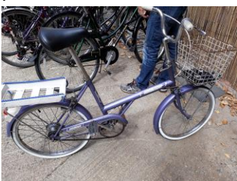
1 e fiets

Over de inhoud van het evenement ben ik zeer te spreken, alhoewel ik het bezoek aan drie projecten en het volgen van acht presentaties iets te veel vond voor één dag. Daarbij zou het handig geweest zijn als er van de presentaties "hands-outs" aanwezig waren, zodat deze presentaties beter te volgen geweest zouden zijn, immers de spreek(st)ers waren niet versterkt.