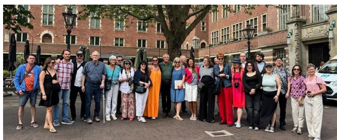
De groep uit Toruń en Leiden voor Stadhuis

Wederom konden we dit jaar een groep uit Toruń ontvangen in de week van 18 tot 21 juni. Wel een wat kleinere groep van 20 personen inclusief chauffeurs, dan wat we voorgaande jaren gewoonlijk konden verwachten. Gelukkig maar, omdat we dit kleinere aantal net nog onder konden brengen bij onze gastouders. Deze voor ons zeer belangrijke groep wordt jammer genoeg jaarlijks steeds kleiner. Wij konden ze een bijzonder aantrekkelijk programma aanbieden, met o.a. ontvangst op Stadhuis, bezoek aan kasteel Haarzuilens, traditionele vaartocht door Leiden en afsluitende BBQ in het Logegebouw.