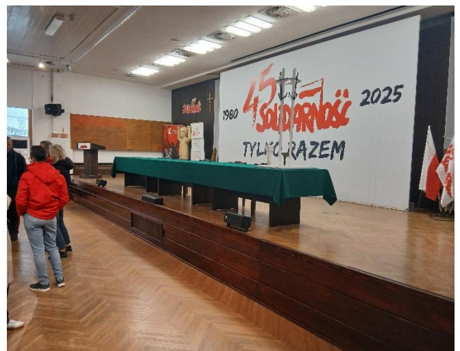
BHP hal, bij de tafel van het 1980 Gdańsk Akkoord