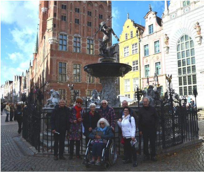
Neptunusbeeld- en fontein op het Dlugi Targ

beroemde 17 e eeuwse Neptunusbeeld- en fontein op het Dlugi Targ (Lange Markt) plein.