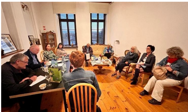
Vergadering van de TMPT en Stedenband

Rond zessen werd de expositieopening gevolgd door de inmiddels traditionele vergadering van aanwezige leden van TMPT en onze stedenband Leiden-Toruń, in een andere zaal binnen hetzelfde gebouw.