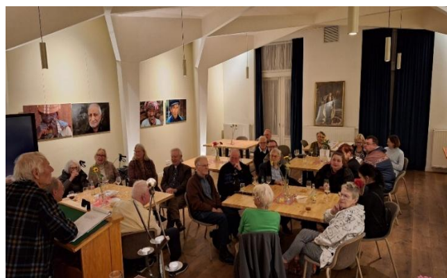
Contact-Informatieavond in het Logegebouw

chauffeurs. Onze vrienden in Toruń hadden gezorgd voor een aantrekkelijk programma met o.a. een vaartocht op de Wisla en bezoek aan Gdansk. Het officiële ontvangst op het Stadhuis was extra belangrijk, omdat we konden pleiten voor het behoud van gebruik van het Podmurna Poortgebouw in Toruń, belangrijk voor de Stedenband activiteiten.