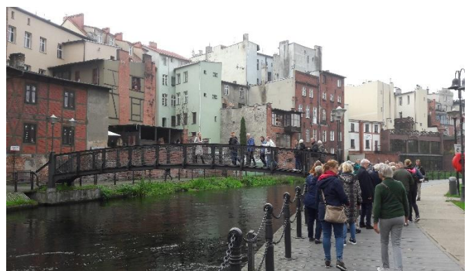
Bezoek aan Bygoszcz