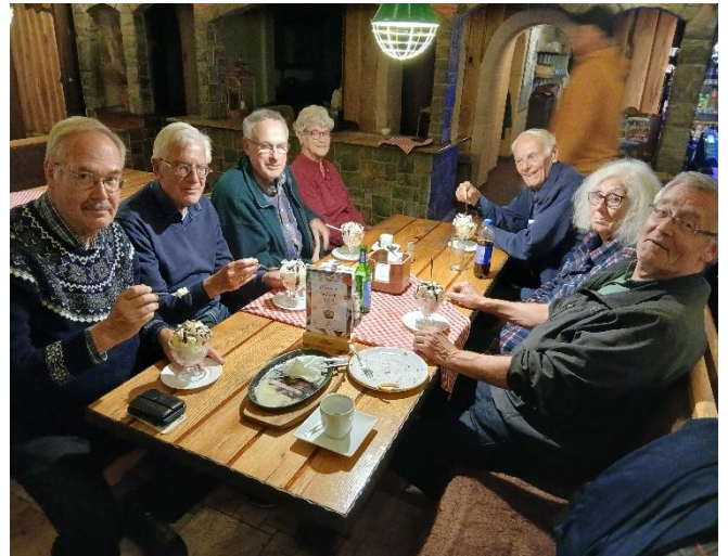
Maaltijd in restaurant Zajazd Chroby te Torzym

De volgende dag, zaterdag 11 oktober, vertrok het hele reisgezelschap met het busje vanaf Hotel Gromada in het begin van de middag om wederom in Motel u Olka te Boczów te overnachten op de terugreis (Iza vertrok al op eigen gelegenheid in de ochtend). Jagna nam namens TMPT afscheid van ons en zwaaide ons uit. Na het inchecken mij het motel aten wij die avond wederom in restaurant Zajazd Chroby in Torzym. De terugreis voltrok zich zo als een soort spiegelbeeld van de heenreis.