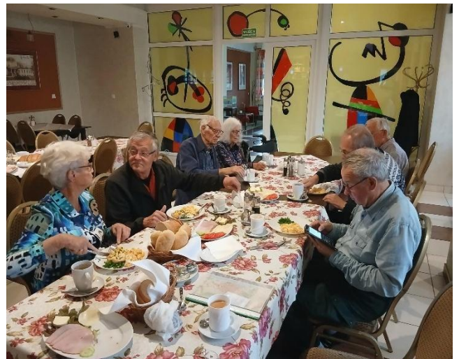
Ontbijt in Motel u Olka te Boczów

De ochtend daarop ontbeten wij echter in Motel u Olka. In de ochtend van 8 oktober vertrokken wij na een voedzaam ontbijt vol goede moed van Boczów naar Toruń, waar wij rond 13:00 arriveerden bij Hotel Gromada aan ul. Żeglarska 10 in het oude centrum.