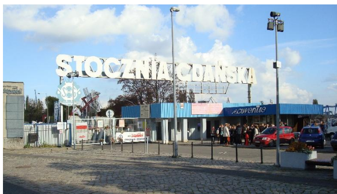
Bezoek aan Gdańsk

Door deze uitwisselingen zijn er langdurige vriendschappen ontstaan tussen inwoners van Leiden en Toruń.