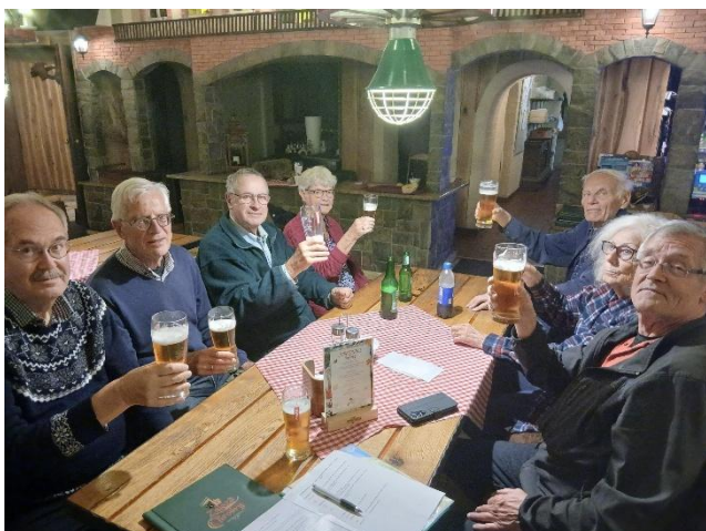
Avondmaaltijd in Zajazd Chroby te Torzym.

De heenreis verliep voorspoedig: rond 18:00 arriveerden wij in Polen bij Motel u Olka aan ul. Sikorskiego 25 in Boczów net voorbij de Pools-Duitse grens voor een overnachting. Na het inchecken hadden wij een gezamenlijke avondmaaltijd in de ons welbekende restaurant Zajazd Chroby in het nabijgelegen dorp Torzym.