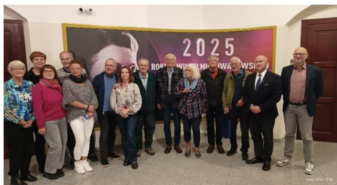
Groepsfoto in het stadhuis van Toruń

Daarna werden uitgebreide groepsfoto's gemaakt in de hal op de eerste verdieping van het stadhuis.