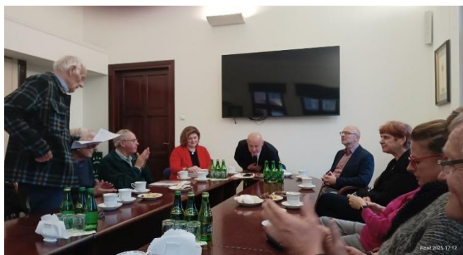
Dankwoord en overhandigen van presentjes