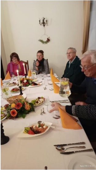
Foto impressie van de reis naar Toruń van 7 t/m 12 oktober 2025