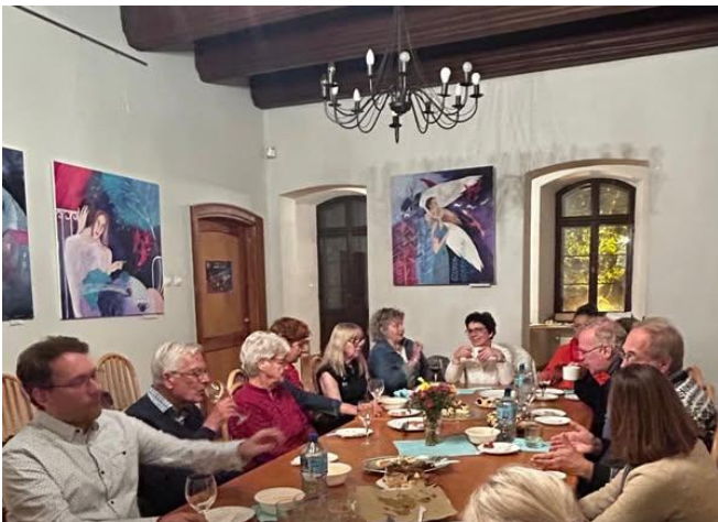
Avondeten met broodjes, pizza's en wijn

Vervolgens kon ieder van ons op eigen gelegenheid of met reisgenoten nog een uurtje rondlopen om te shoppen enz. alvorens terug te keren naar de parkeerplaats bij de kerk even na vieren, om terug te keren naar Toruń. Door vastzittend verkeer rond enkele rotondes in Gdańsk duurde de terugreis zeker een half uur langer. Gelukkig kwamen wij op tijd terug voor het avondeten met broodjes, pizza's en wijn in het Podmurna gebouw, aangeboden door onze zusterorganisatie TMPT. De laatste was ook met meerdere leden aanwezig, en enkele uitgenodigde gasten.