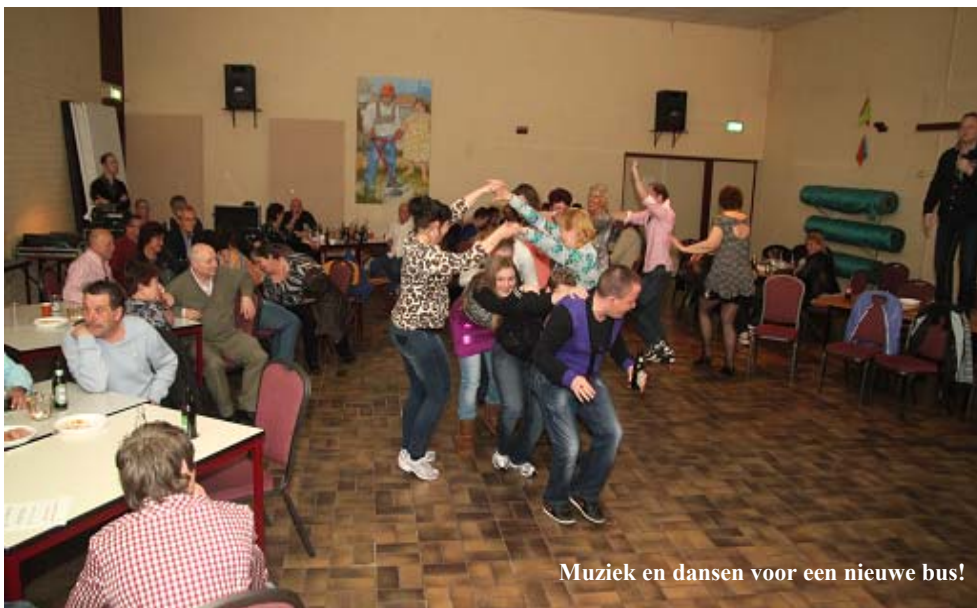
Muziek en dansen voor een nieuwe bus!