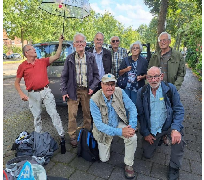
De personen die in 2024 in Toruń zijn geweest

Het was een geslaagde reis. De Stedenband Toruń kreeg toch nog wat geld van de Gemeente om ons te ontvangen en een aangepast programma te organiseren.