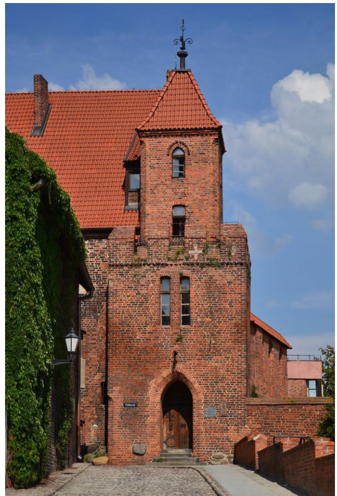
Het Poortgebouw ofwel het Burgerhuis

De Stedenband organisatie Toruń-Leiden, die het meest actief is heeft nu de toezegging gekregen het gebouw nog te kunnen gebruiken tot eind 2025. Wat daarna gebeurt is onzeker. Dit zou kunnen betekenen dat wij, als we Toruń bezoeken, geen gebruik meer kunnen maken van dit voor ons zo markante gebouw, waaraan we zoveel herinneringen aan hebben.