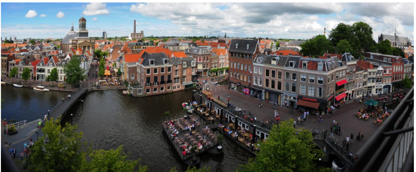
Panorama van Leiden