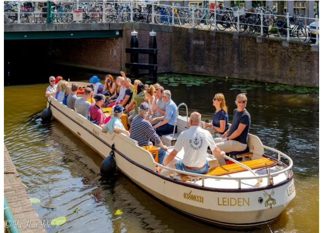
Toruń in Leiden in 2019

hebben het in die week druk met allerlei commissie vergaderingen. Wel is een lunch gepland voor de bezoekers, waarbij een wethouder aanwezig zal zijn en er ook kennis wordt gemaakt met de Burgemeester.