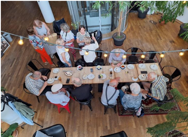
Ontvangst met koffie en taart in het museum

Woensdag 21 augustus was het weer omgeslagen: regen. Het juiste weer voor bezoek aan het compleet veranderde Copernicushuis. Twintig jaar eerder was ik er geweest en toen was de expositie vooral gewijd aan de fabelachtige meet- en rekenkunst van de astronoom Copernicus. Nu was het meer op familiebezoek gericht en stonden zijn reizen en bezoeken aan diverse steden centraal. Een mix van beide zou ik beter vinden. De planning voor de middag was een bezoek aan de compleet vernieuwde Boulevard (Bulwar Filadelfijski). Harde regen zat dit bezoek in de weg. In plaats daarvan bezochten we het Museum van moderne kunst. Dat was op dat moment gericht op de collectie van de voormalig Poolse proftennisser Wojciecha Fibaka. Hij heeft met een deel van zijn tennisverdiensten schilderijen van aankomende Poolse kunstenaars gekocht. Figuratief en deels non-figuratief.