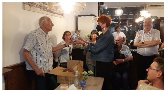
Leidse stroopwafels voor de organisatie in Toruń

Het werd een geslaagd bezoek, mede omdat onze vrienden in Toruń toch nog konden zorgden voor een bijzonder aantrekkelijk programma. In deze Nieuwsbrief wordt u daarover nog geïnformeerd.