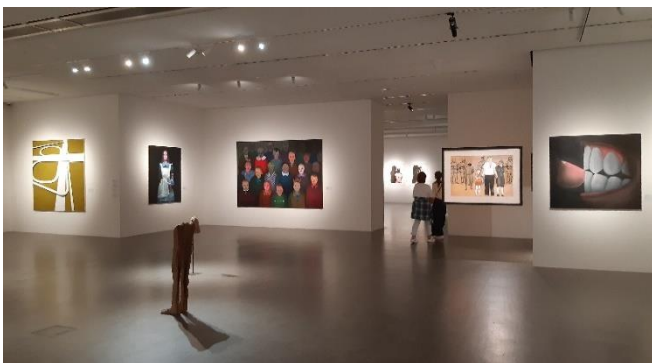
Tentoonstelling van Wojciecha Fibaka

Met enige voorzichtigheid, ik ben geen groot kunstkenner, zag ik slechts één schilderij die ik wel thuis zou willen ophangen.