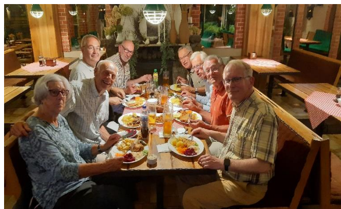
Zondagavond maaltijd in Zajazd Chrobry in Torzym

We zagen dat op de andere kant, de grens Polen-Duitsland, er een gigantische file van stilstaande auto's was vanwege het net ingegane beleid van grenscontroles in Duitsland, een waarschuwing voor ons voor de terugreis. Maandagochtend reden we al vroeg over de tolweg richting Toruń. De chauffeurs volgden de aanwijzingen voor de kortste route. Deze bleek al rijdende de meest tijdrovende te zijn met veel 50 km wegen met tractoren en dorpjes met stoplichten.