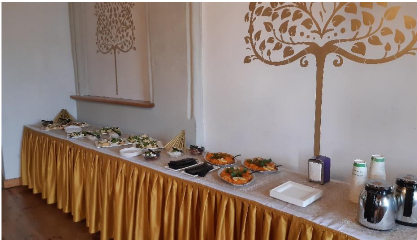
Afscheidsbuffet in het Poortgebouw (Pod Murna)

We kregen we een heerlijke Poolse maaltijd aangeboden van soep en diverse salades. Dankzij het mooie zomerweer konden we nu ook buiten zitten met uitzicht op de Wisla. Omdat we pas de volgende dag weer huiswaarts zouden keren konden we na het buffet nog een stadswandeling maken en genieten van de prachtig verlichte nieuwe boulevard. Donderdag begon de terugreis naar Nederland.