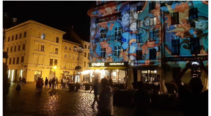
Lichtjesfeest in de stad

Daarna hebben we als werkgroep Leiden een nuttig overleg gehad met onze Toruńse partner in het vertrouwde Poortgebouw (Pod Murna) waarbij we de intentie afspraken om voor 2025 twee gelijkwaardige bezoeken over en weer te realiseren. Als afsluiting van het bezoek kregen wij een smakelijke Poolse maaltijd van soep en salades. Daarna nog even een stadswandeling in het donker, maar vanwege het lichtjesfeest met allerlei lichtjes en met videobeelden bij en op een aantal monumentale gebouwen.