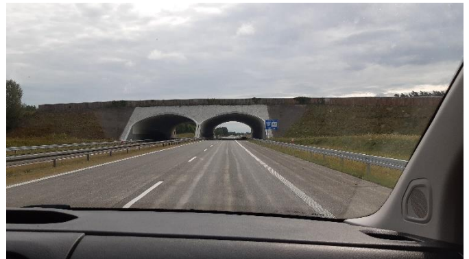
Een van de vele ecoducten in Polen