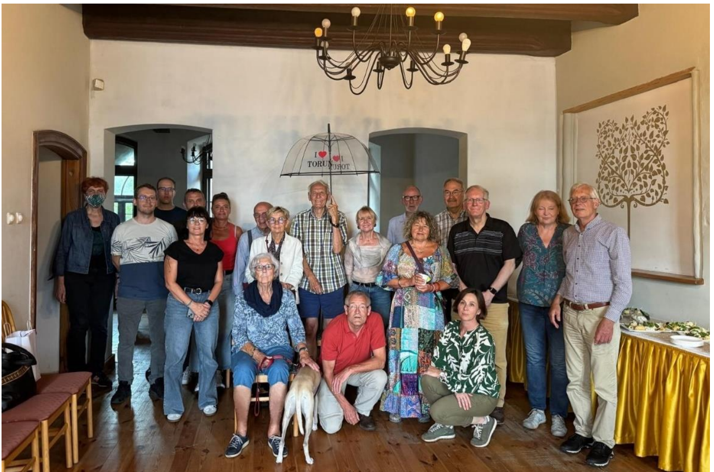
Groepsfoto van de groep uit Toruń en Leiden tijdens het afscheidsbuffet op woensdag